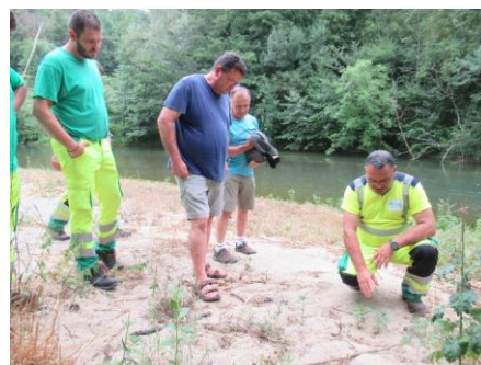
Agents du CD09 : observation d'ambrosies à feuilles d'armoise, au bord de l'Hers, juin 2022 (Gaudiès - 09)

Les formations sont proposées sur une journée, avec un temps en salle, pour un apport théorique (qui sont les ambroisies ? comment les reconnaître ? leurs impacts, leur écologie et biologie, pistes de gestion en bord de route...) et un temps sur le terrain, pour aller voir les 2 espèces présentes dans le département (ambrosies à feuilles d'armoise et ambroisies trifides).